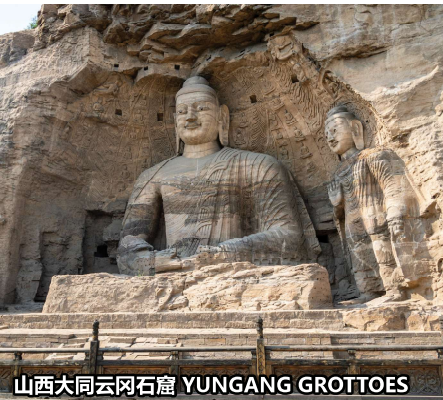
山西大同云冈石窟 YUNGANG GROTTOES