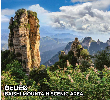
白石山景区 BAISHI MOUNTAIN SCENIC AREA