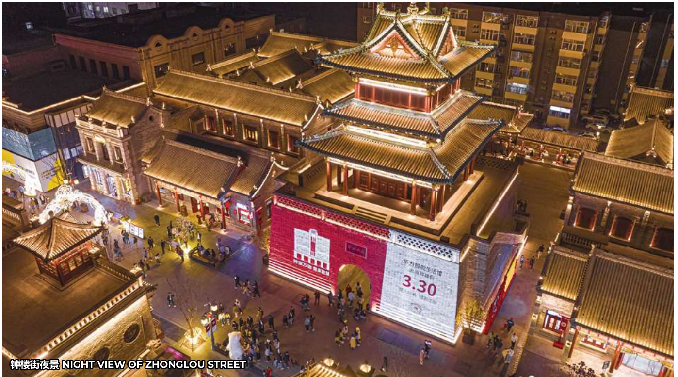
钟鼓楼夜景 NIGHT VIEW OF ZHONGLOU STREET