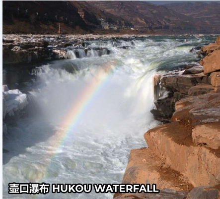
壶口瀑布 HUKOU WATERFALL