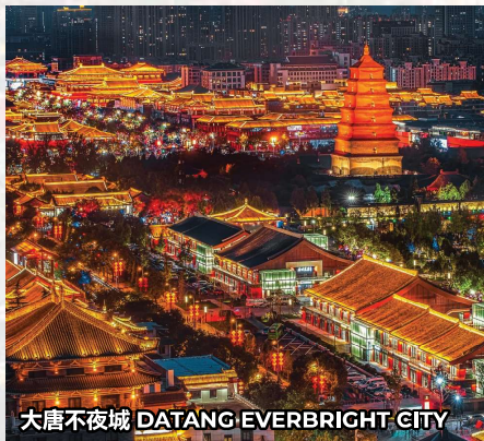
大唐不夜城 DATANG EVERBRIGHT CITY

早餐后，乘车前往非遗传承铜川花月荟街区，探秘非遗花月荟耀瓷工坊，了解北宋耀瓷纹饰特点、装饰手法等和耀州窑文化，近距离揭秘倒流壶、公道杯的制作原理。深度体验耀州瓷非遗刻花技艺，了解耀州瓷器纹饰工艺的装饰手法和铜川非遗物质文化剪纸，体验非遗剪纸乐趣。了解铜川非遗美食并动手体验制作陕西第一面窝窝面，之后前往草莓星球采摘水果，根据季节采摘不同的水果，如：樱桃、苹果、葡萄、圣女果等，之后乘车返回西安。 酒店：西安原印力诺富特酒店或同级*