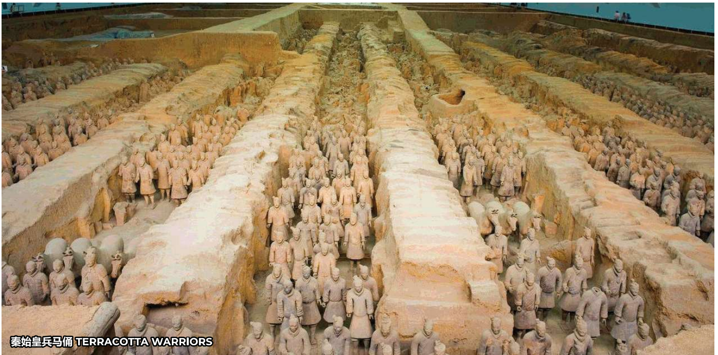
秦始皇兵马俑 TERRACOTTA WARRIORS