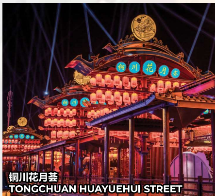
铜川花月荟 TONGCHUAN HUAYUEHUI STREET

早餐后，参观长安十二时辰文化街，将唐朝的市井生活还原，满足你对大唐生活的所有想象！整体打造集全唐空间游玩、唐风市井体验、主题沉浸互动、唐乐歌舞演艺、文化社交休闲等为一体的全唐市井文化体验地。接着，夜游大唐不夜城，整体风格仿唐文化建筑，汇集了各种创意表演，展现了盛唐文化。晚餐后依约定时间前往机场。