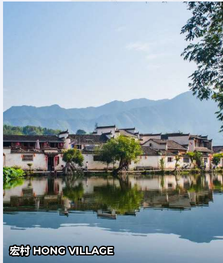
宏村 HONG VILLAGE