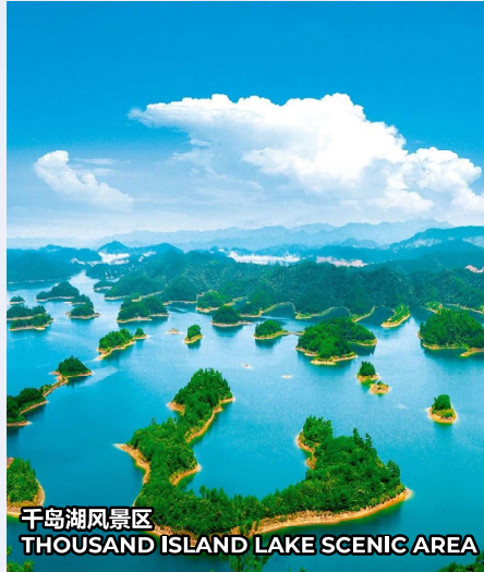
千岛湖风景区 THOUSAND ISLAND LAKE SCENIC AREA