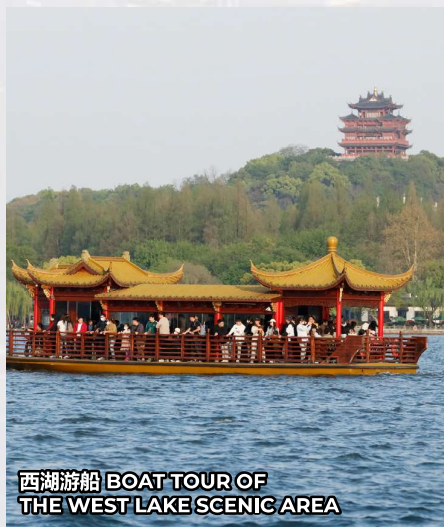
西湖游船 BOAT TOUR OF THE WEST LAKE SCENIC AREA