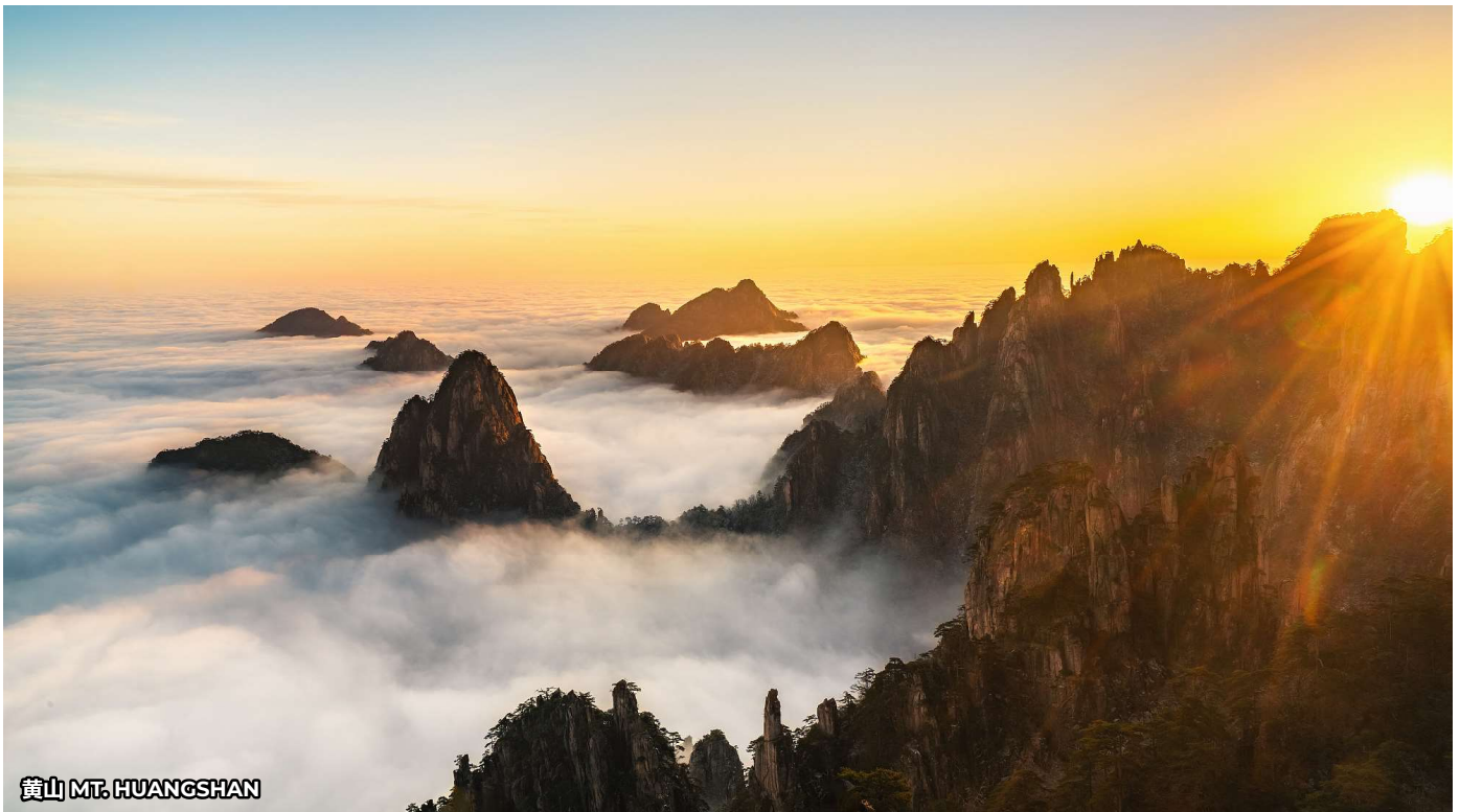
黄山 MT. HUANGSHAN