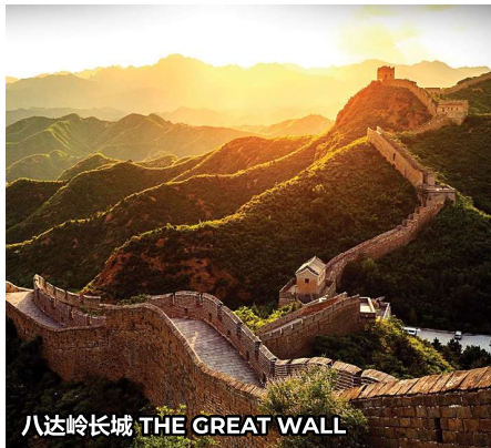
八达岭长城 THE GREAT WALL