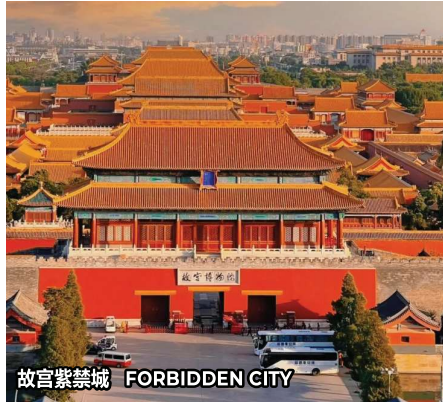
故宫紫禁城 FORBIDDEN CITY