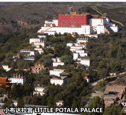
小布达拉宫 LITTLE POTALA PALACE