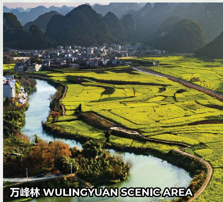
万峰林 WULINGYUAN SCENIC AREA