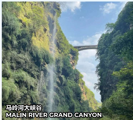
马岭河大峡谷 MALIN RIVER GRAND CANYON