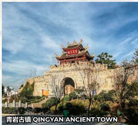
青岩古镇 QINGYAN ANCIENT TOWN