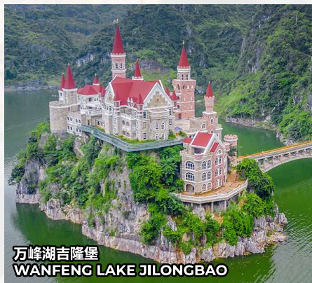
万峰湖吉隆堡 WANFENG LAKE JILONGBAO