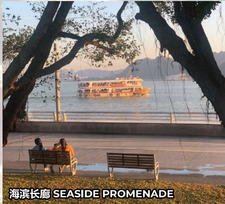
海滨长廊 SEASIDE PROMENADE