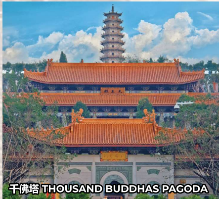
千佛塔 THOUSAND BUDDHAS PAGODA