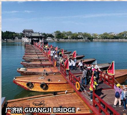
广济桥 GUANGJI BRIDGE