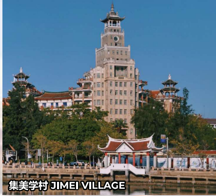
集美学村 JIMEI VILLAGE