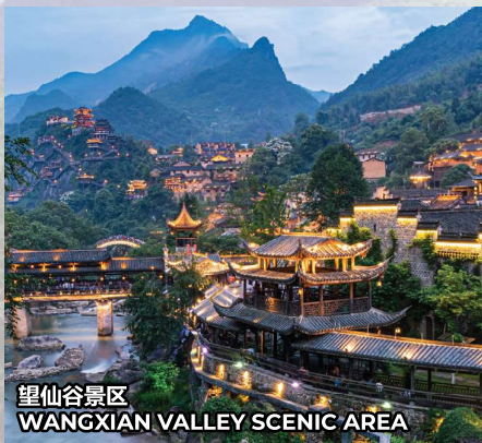
望仙谷景区 WANGXIAN VALLEY SCENIC AREA