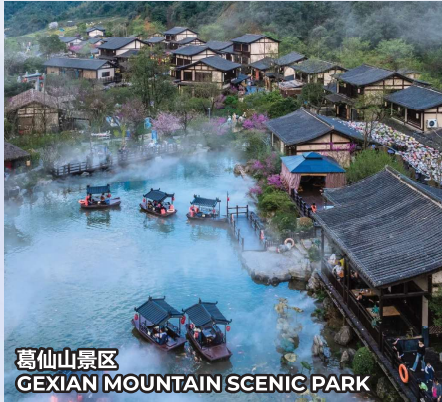
葛仙山景区 GEXIAN MOUNTAIN SCENIC PARK