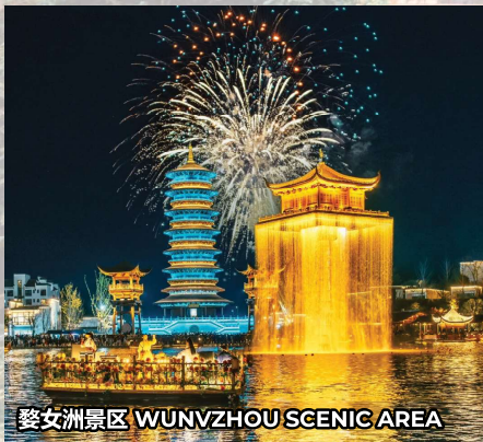
婺女洲景区 WUNVZHOU SCENIC AREA