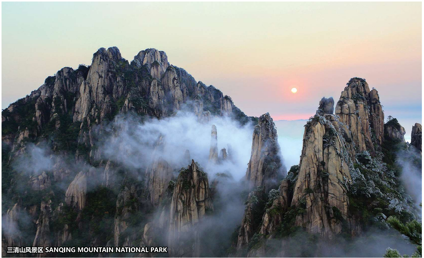
三清山风景区 SANQING MOUNTAIN NATIONAL PARK