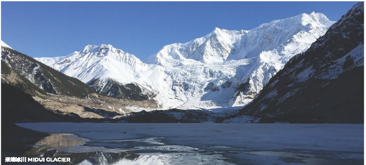
米堆冰川 MIDUI GLACIER