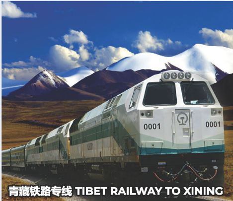
青藏铁路专线 TIBET RAILWAY TO XINING