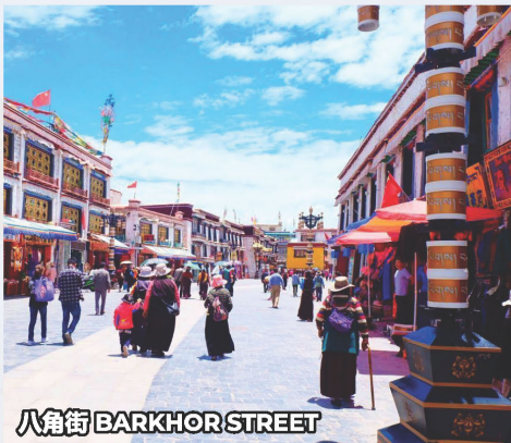
八角街 BARKHOR STREET