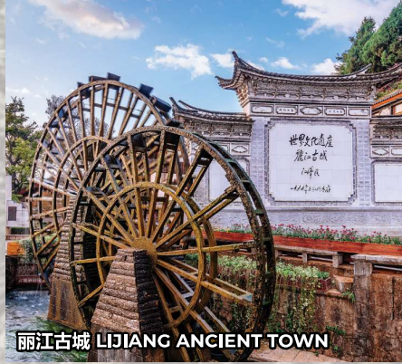
丽江古城 LIJIANG ANCIENT TOWN