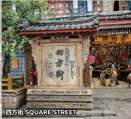
四方街 SQUARE STREET