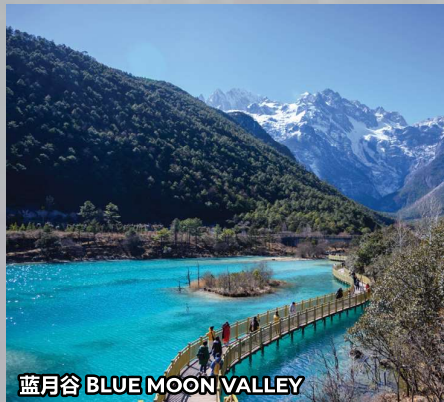
蓝月谷 BLUE MOON VALLEY