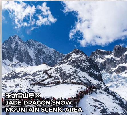
玉龙雪山景区 JADE DRAGON SNOW MOUNTAIN SCENIC AREA