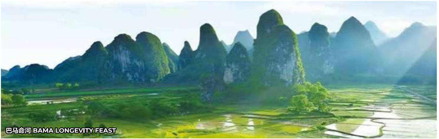
巴马命河 BAMA LONGEVITY FEAST