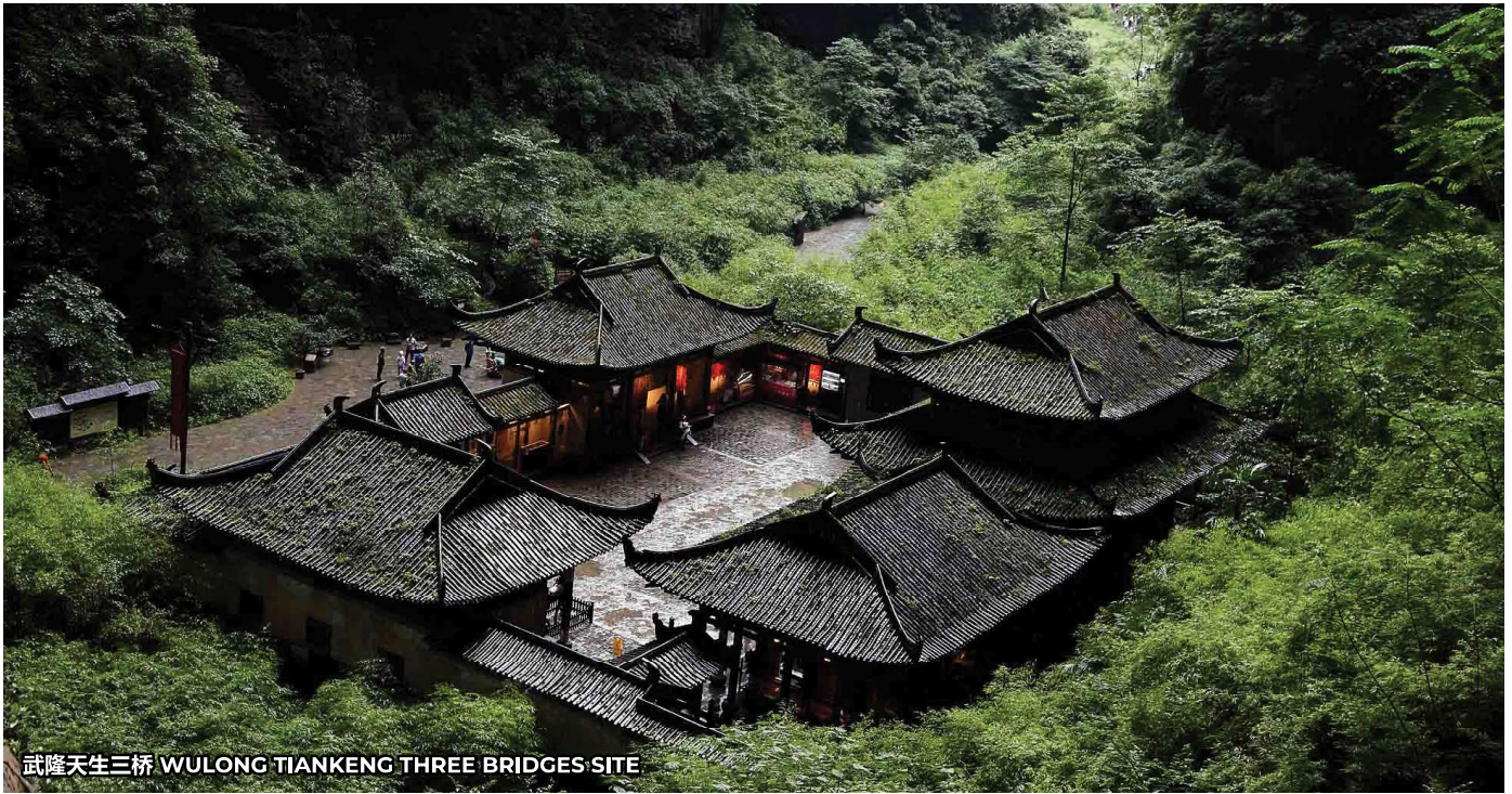
武隆天生三桥 WULONG TIANKENG THREE BRIDGES SITE