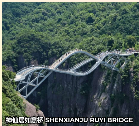
神仙居如意桥 SHENXIANJU RUYI BRIDGE