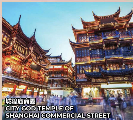
城隍庙商圈 CITY GOD TEMPLE OF SHANGHAI COMMERCIAL STREET