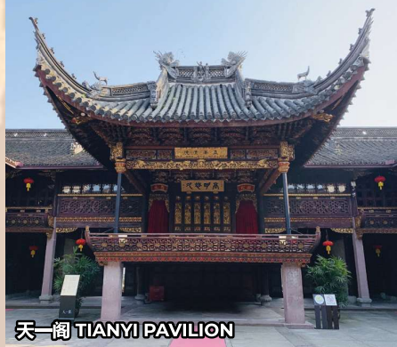
天一阁 TIANYI PAVILION