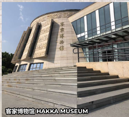
客家博物馆 HAKKA MUSEUM