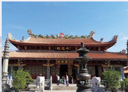
潮州开元寺 CHAOZHOU KAIYUAN TEMPLE