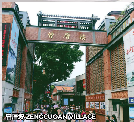
曾厝垵 ZENGCUOAN VILLAGE